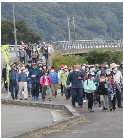
ウォーク中の参加者