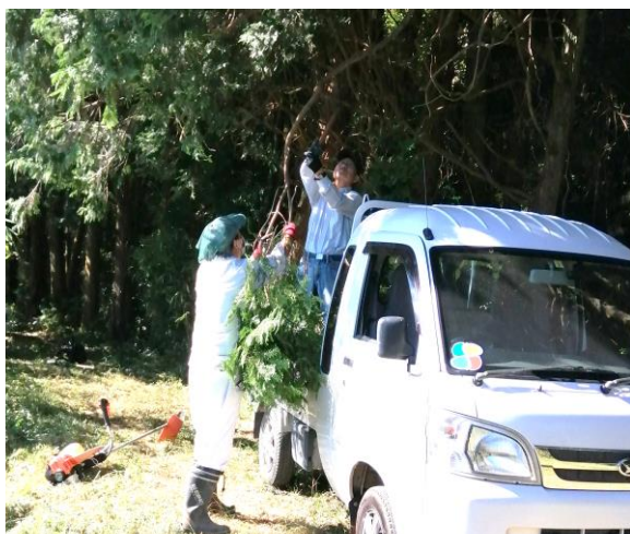
ウォーキングコース整備風景

尚、ウォーキングを開催するに当たり、部会員の方々に、参加者が安全に歩けるようにコースの整備や草刈りそして、川に仮橋を掛けて頂くなど大変な協力をして頂きました。この場をお借りしてお礼申し上げます。本当に有難う御座いました。