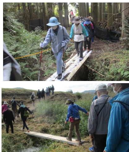
仮橋を恐る恐る渡る参加者