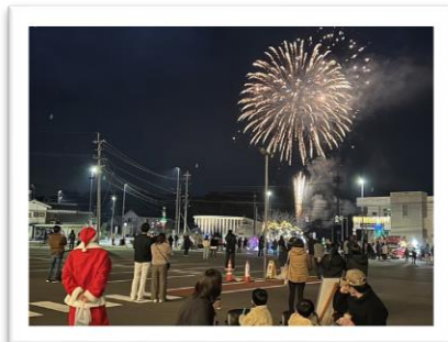
個人的には冬の花火が好き