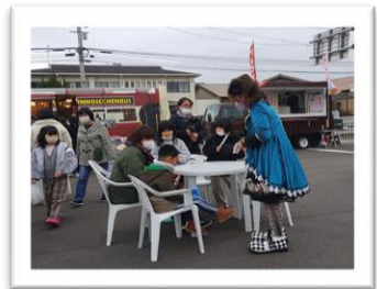
マジシャンは子どもに大人気！おっかけも誕生！