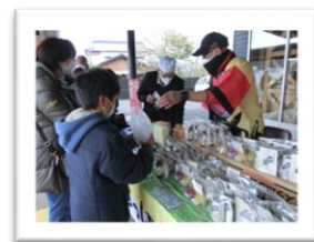
空くじなしのすっぽんくじに大行列