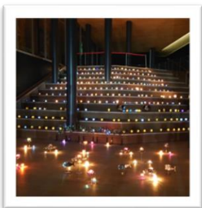
幻想的な空間で癒やしの時間を

また、舞台周りの道具や飾り物の制作、チケット販売等については地域の方に、当日までの様々な段取りや会場運営はPTAの方々にご協力をいただきました。その他ご協力頂いた全の方に感謝いたします!!