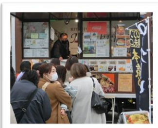
どのキッチンカーも大人気！