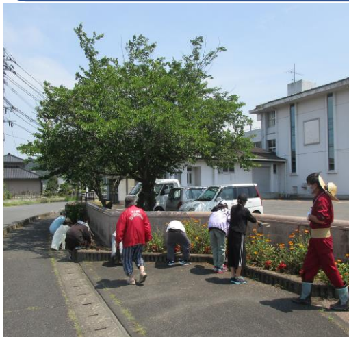
安小校門での花植え風景

又、その日の午前中にライオンズ主催で文化会館前の花壇の花植えも行いました。各種団体、まち協と安高生の参加で短時間で終える事が出来ました。