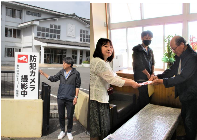
防犯カメラ目録授与と看板設置風景

一昨年、町内で殺人事件が発生し未だ解決しておらず不安な日が続いています。それで、少しでも安心して学べるようにと学校と部会との思惑が一致し、これが今回実現しました。