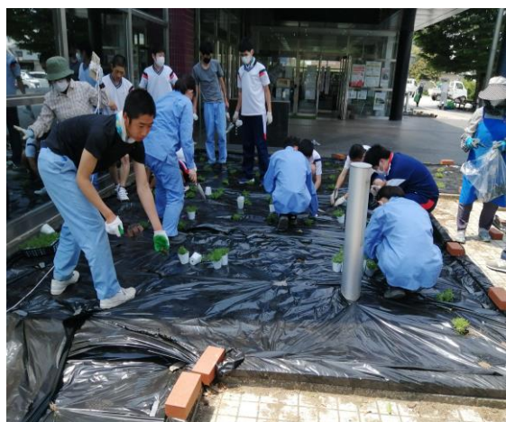
文化会館前花壇の花植え風景